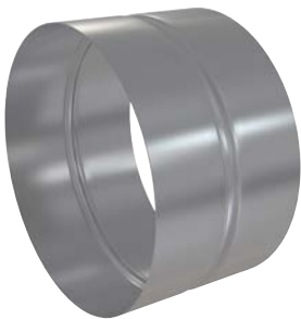
Skjøtemuffe i galvanisert stål. Skarvmuff av galvaniserat stål. Fixing sleeve in galvanised steel.

ART.NR.: 12081, 12082, 12083, 12084, 116959, 02281, 02282, 100712, 02283